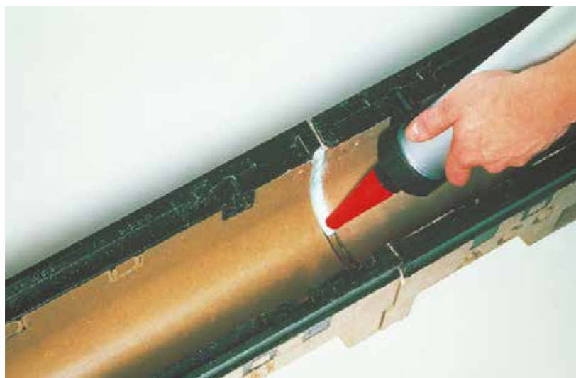
Нанесение герметизирующей массы